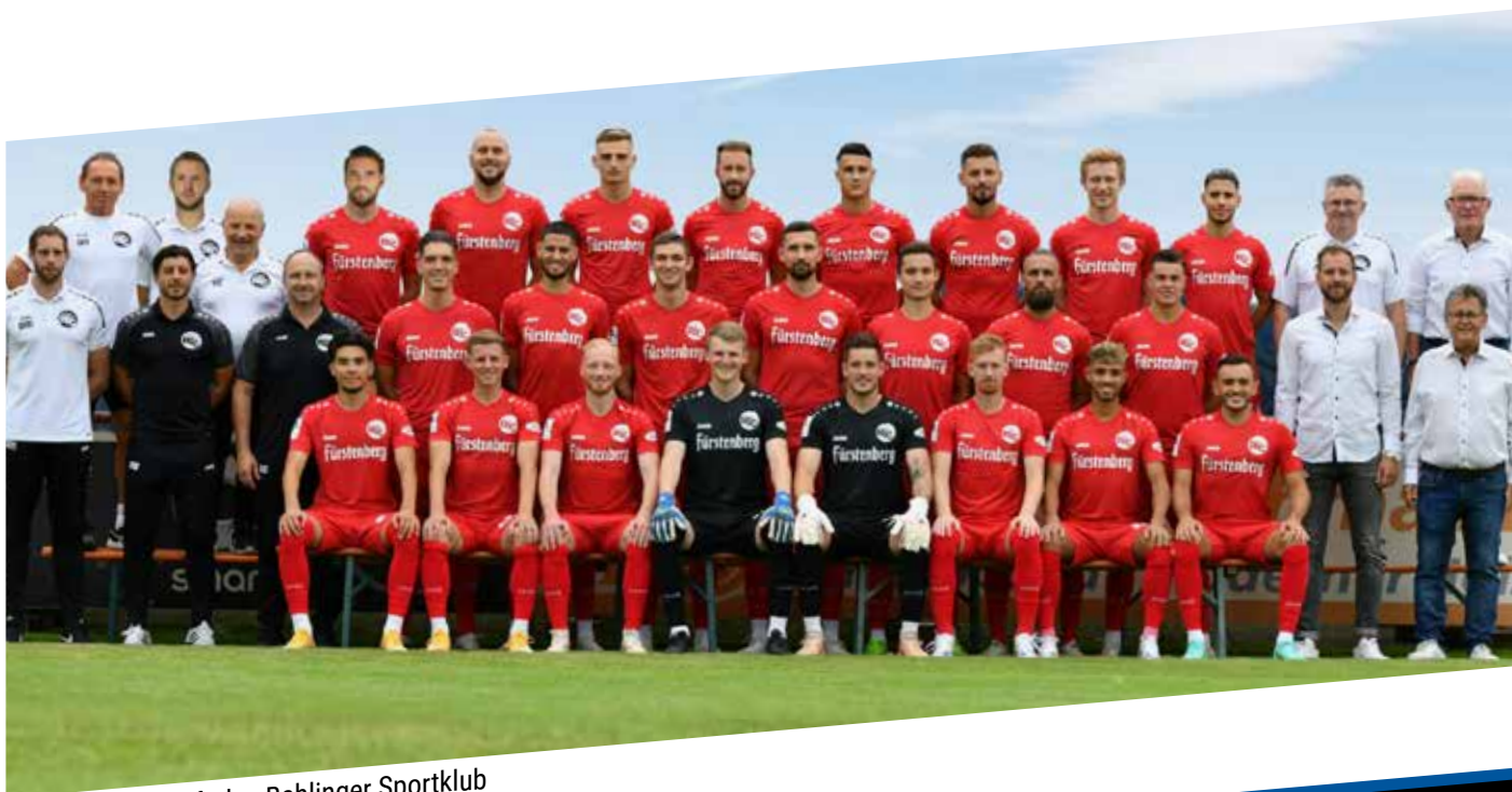
Die 1. Mannschaft des Bahlinger Sportklub

gangenen Mittwoch die SG Sonnenhof Großaspach mit 1:0 bezwingen. So ist der Bahlinger SC nach sieben gespielten Partien auf Platz fünf der Regionalliga Südwest wiederzufinden. Erfolgsgarant ist sicher die schwer auszurechnende Offensive der Bahlinger: Neun Treffer haben die Bahlinger in dieser Spielzeit bislang erzielt und dabei haben sich bereits sechs Spieler in die Torjägerliste eingetragen – ein starker Wert!